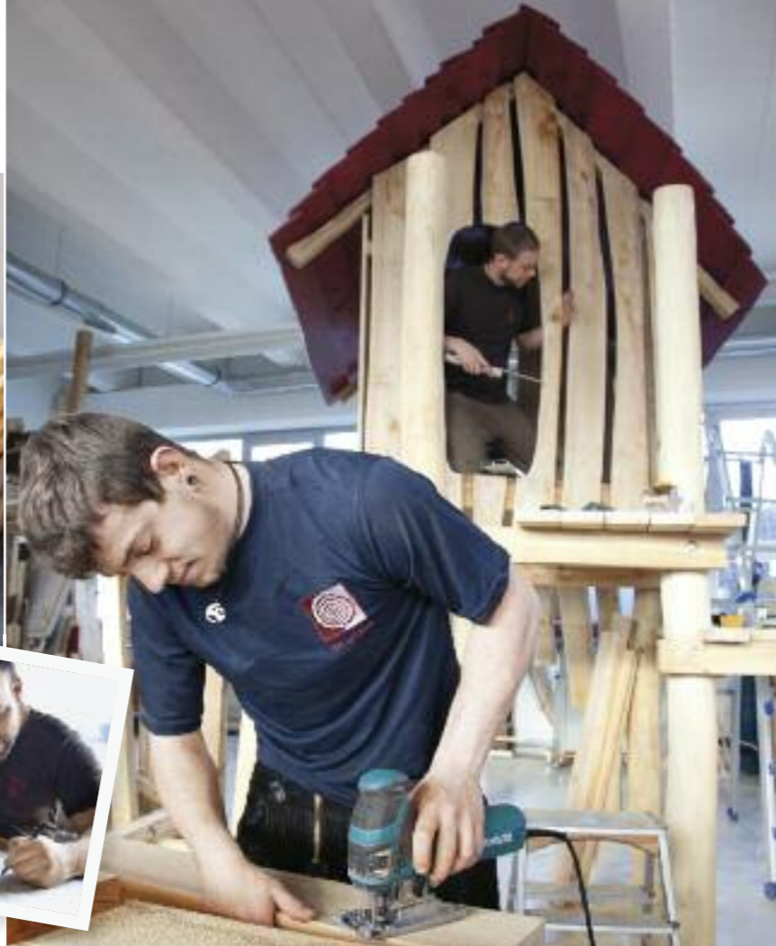
In der Werkstatt entstehen die meisterhaften Spielgeräte – wenn es schwer wird hilft der große Maschinenpark