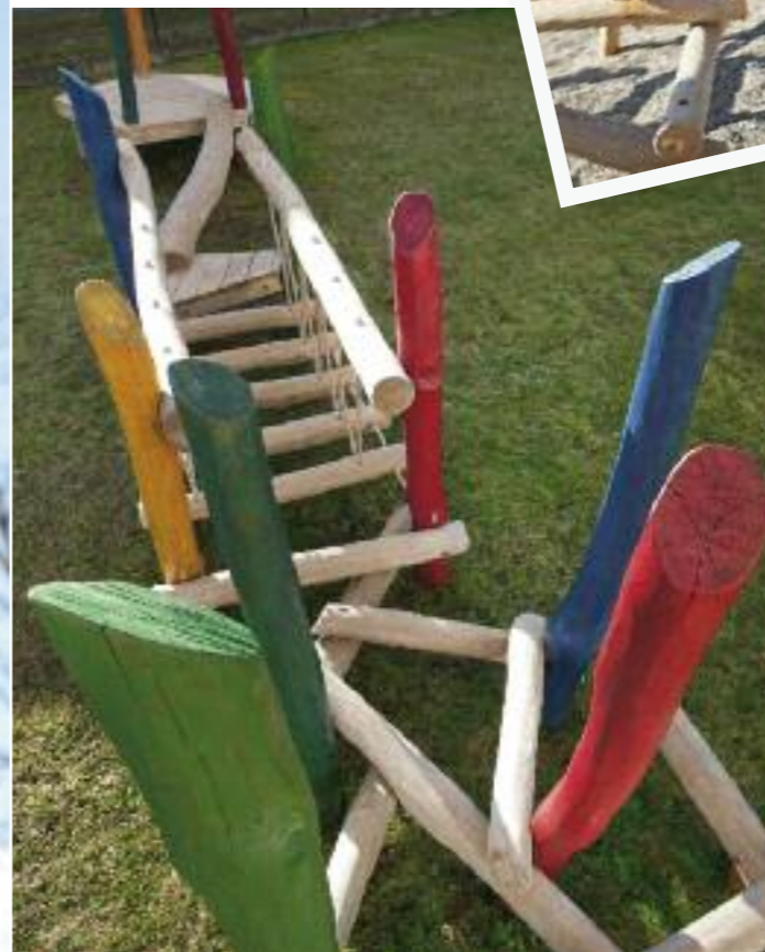
Spielgeräte die die Kreativität wecken – Holz Spiel Natur baut sie für jede Altersstufe